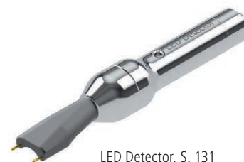
LED Detector, S. 131