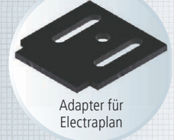
Adapter für Electraplan